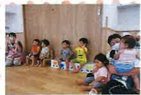
「おようございます」 笑顔で1日が始まります