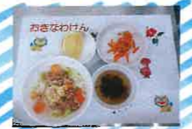
月に1度の郷土料理メニュー「いただきます!」