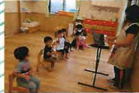
朝の会では季節の歌をうたったり出席確認をします