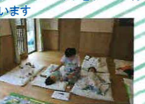
みんなスヤスヤ夢の中Zzzz ブレスのチェックをしっかり行います