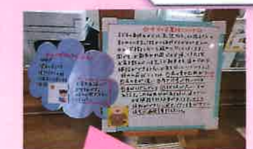
保護者向けのお知らせ

全園児の体調確認や 健康管理、身体測定、 発熱や怪我の対応など を行っています。