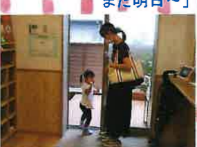
「今日も楽しかったわ! また明日~」