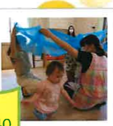
外国人講師による英語レッスン