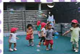
お散歩やリトミック等毎日様々な活動を行います