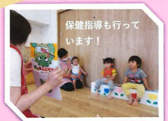
保健指導も行って います!