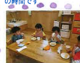
お昼寝の後は楽しいおやつの時間です