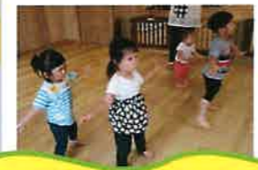
♪リトミック♪ 毎週水曜日 10:00~10:40 講師:カワイ音楽教室

りとるういずでは0歳児から2歳児まで外部講師によるリトミックを行ったり、3歳児からは外国人講師による英語レッスンを取り入れています。五感をたくさん刺激し脳の発達を促し、子どもたちの持つ様々な能力を引き出すことを目的としています。