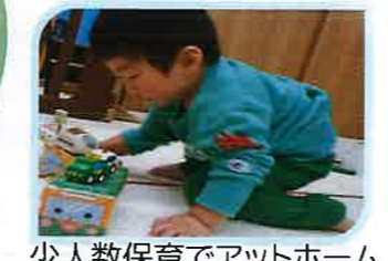
少人数保育でアットホーム